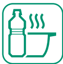
HUILES DE FRITURES