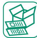
PAPIERS / CARTONS