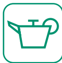
HUILES DE VIDANGE