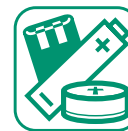
PILES ET ACCUMULATEURS