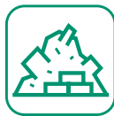
DÉBLAIS / GRAVATS