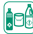
DÉCHETS DIFFUS SPECIFIQUE (DDS)